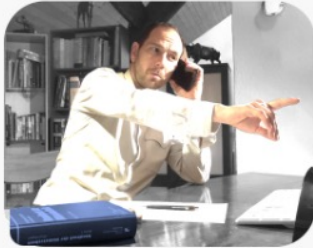
Eine professionelle Baukoordination kann viel Ärger verhindern

Bereits ein einfacher Heizungsersatz bringt vieles an Vorbereitungen und Koordination mit sich. Wir unterstützen Sie bei der Beantragung von Bewilligungen und Fördermitteln , der Wahl der Handwerker , sowie der Organisation, Überwachung und Abnahme der Arbeiten.